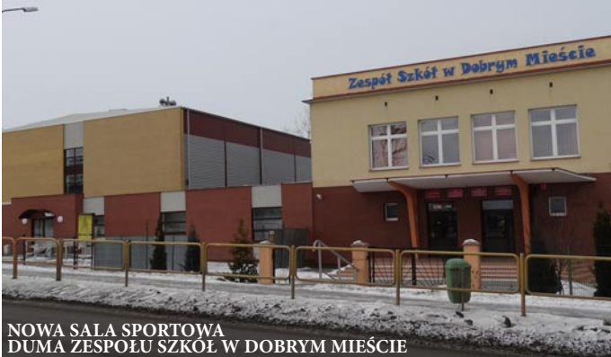
NOWA SALA SPORTOWA DUMA ZESPOŁU SZKÓŁ W DOBRYM MIEŚCIE